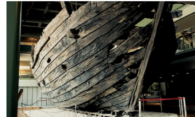
Die Kogge: Deutsches Schifffahrtsmuseum

Die Entdeckung der Bremer Hansekogge 1962 war ein Höhepunkt der deutschen Schiffsarchäologie. Nun haben Studierende der Hochschule Bremerhaven im Rahmen einer Kooperation mit dem Deutschen Schifffahrtsmuseum das „Spiel zum Fund“ entwickelt. Ziel des Computerspiels ist es u.a. mit der Kogge sicher im Hafen anzukommen und durch geschicktes Handeln hohe Einnahmen zu erzielen. 17.05. – 30.06.