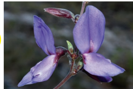
Dioclea lasiophylla Mart. ex Benth. (Leguminosae, Papilionoideae)

Die Menschen kamen aus vielen Gründen nach Bremen: Suche nach Arbeit, Vertreibung, Anziehung durch Kultur und Ausbildungsmöglichkeiten. Millionen von Auswanderern zogen durch die Stadt, Zwangsarbeiter waren inmitten der Quartiere interniert, chilenische Flüchtlinge fanden ein Asyl an der Universität. Der Arbeitskreis Bremer Archive präsentiert Migrationsgeschichte(n) dieser Stadt. Zu sehen vom 11. Juni bis 08. August.