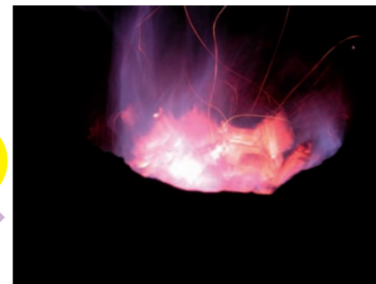
Blick in die Gicht eines Verhüttungsofens