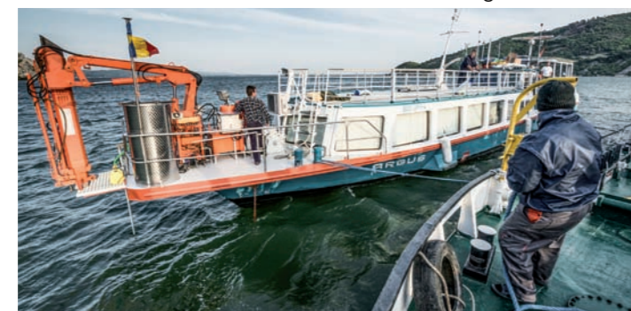
Die MS Argus, Reportage_6; Thema: Forschung im Fluss

Zum neunten Mal wurde im Rahmen von „Wissen um 11“ der „deutsche preis für wissenschaftsfotografie“ von der Zeitschrift „bild der wissenschaft“ und dem Düsseldorf Pressebüro Brendel verliehen. Der Wettbewerb richtet sich an alle, die aktuelle Forschung und Technologie ansprechend und ungewöhnlich ins Bild setzen. Die prämierten Bilder können bis zum 20. Januar im Haus der Wissenschaft besichtigt werden.